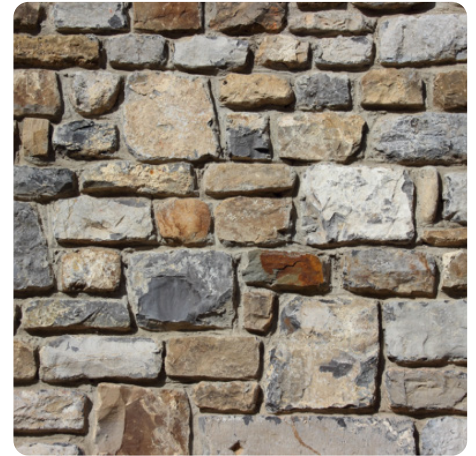
Pietre, graniti e marmi