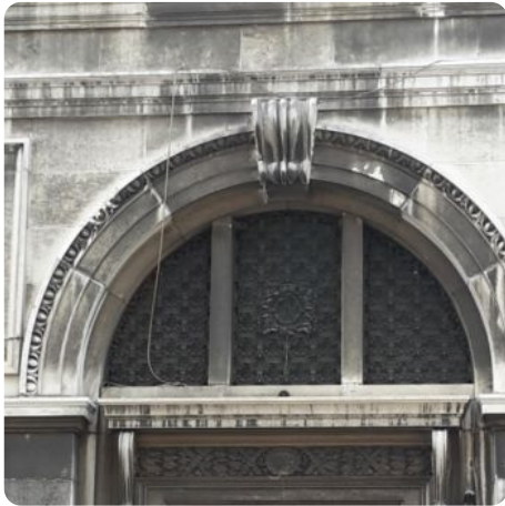
Macchie di smog e graffiti